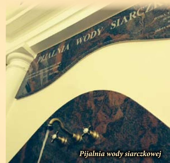
Pijalnia wody siarczkowej